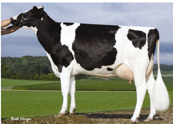
SANDY-VALLEY PLANE SAPPHIRE FIFTH DAM